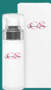
flacone airless con ghiera argento ..... 30 ml

USO: applica la crema mattina e sera con un leggero massaggio su viso, collo e contorno occhi fino a completo assorbimento. Per risultati ottimali, completa il trattamento con il nostro siero super idratante.