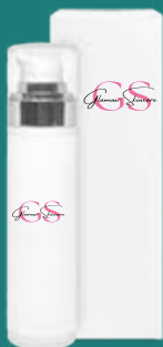
flacone airless con ghiera argento ..... 50 ml

USO: applica il siero mattina e sera con un leggero massaggio su viso, collo e contorno occhi fino a completo assorbimento. Per risultati ottimali, completa il trattamento con la nostra crema super idratante.