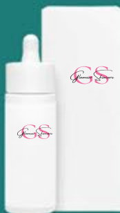
flacone con contagocce ..... 30 ml

USO: applicare 1 volta a settimana uno strato uniforme sulla pelle pulita di viso e collo, evitando la zona del contorno occhi e labbra. Lasciare agire per 5/10 minuti e poi eliminare con una spugnetta umida. Durante il tempo di applicazione si potrebbe avvertire un leggero pizzicore.