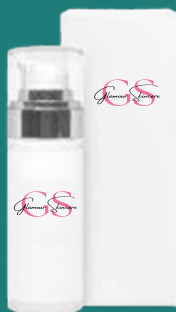
flacone airless con ghiera argento : 30 ml

USO: applica la crema mattina e sera con un leggero massaggio su viso, collo e contorno occhi fino a completo assorbimento. Per risultati ottimali, completa il trattamento con il nostro siero iper rassodante.