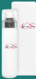
flacone airless con ghiera argento ..... 50 ml