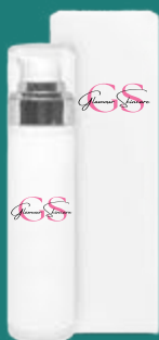
flacone airless con ghiera argento ..... 50 ml