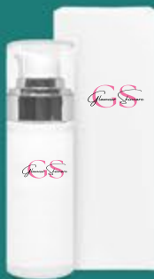
flacone airless con ghiera argento ..... 30 ml

USO: applica la crema mattina e sera con un leggero massaggio su viso, collo e contorno occhi fino a completo assorbimento. Per risultati ottimali, completa il trattamento con il siero più adatto alle tue esigenze.