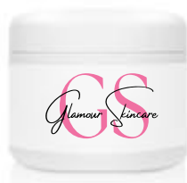
vaso con sottotappo : 650 g 1,3 kg 23,90€