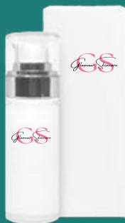
flacone airless con ghiera argento : 30 ml