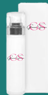
flacone airless : 50 ml con ghiera argento

USO: applica il siero mattina e sera con un leggero massaggio su viso, collo e contorno occhi fino a completo assorbimento. Per risultati ottimali, completa il trattamento con la nostra crema ultra liftante.